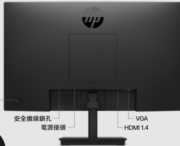
安全纜線鎖孔 電源接頭