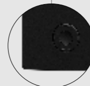
Joypad OSD 功能按鈕